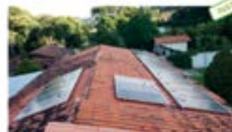
Hotel Pousada em Teixeira-MG Produção de 14. 629 kWh ano - 24 placas Monocristalinas de 325 Watts e 3 Inversores Fronius.

Avenida Bernardes Filho, 89 Loja 02, B. de Lourdes Viçosa . MG Telefone Escritório: (31) 3891-4056 / (31) 9 9787-6565