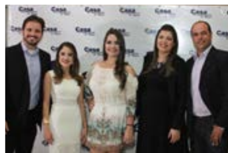
BAILE DA CASA DO EMPRESÁRIO