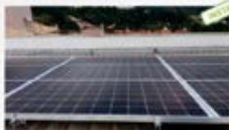
Condomínio Otávio Pacheco, Viçosa-MG Produção 5. 516 kWh. 9 placas Monocristalinas 25 Watts. 1 Inversor Fronius