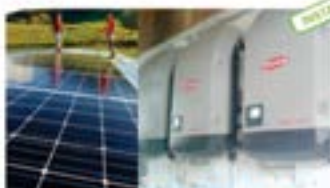
Sítio Urucânia - MG Produção de 11.000 kWh-ano, 15 Placas Monocristalinas de 325 Watts e 3 Inversores Fronius.