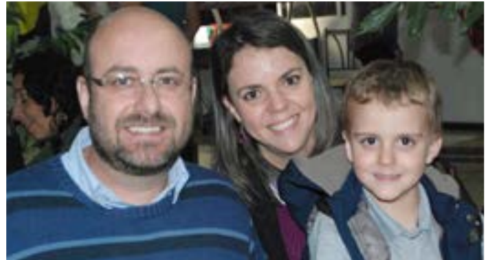
FESTA JUNINA DO ROTARY CLUB DE VIÇOSA