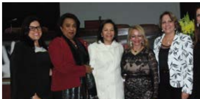
1º ENCONTRO DAS MULHERES DA ZONA DA MATA