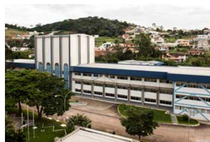
Foto: Campus sede.

Seja na excelência dos cursos de graduação, nas tantas opções de especializações na Pós-Graduação, ou nos serviços prestados à comunidade, o Centro Universitário de Viçosa - Univiçosa vai conquistar você.