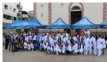
Foto: Os discentes realizam inúmeros atendimentos voltados à população durante as Feiras de Cidadania que acontecem em Viçosa e região.